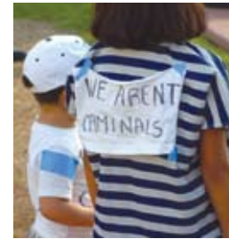
Willie Stark • ONE/MILLION

Le doy esta tarjeta porque no deseo hablar con usted o tener ningún contacto más con usted. Elijo ejercer mi derecho a permanecer en silencio y me niego a contestar sus preguntas. Si me arresta, continuaré ejerciendo mi derecho a permanecer en silencio y a negarme a contestar sus preguntas. Quiero hablar con un abogado antes de contestar sus preguntas.