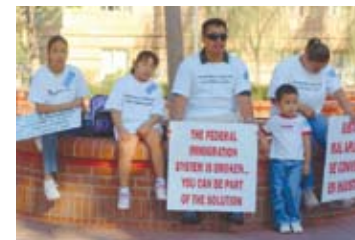
Willie Stark • ONE/MILLION

Los Minutemen no tienen derecho a imponer el cumplimiento de la ley federal de inmigración tomándose la justicia por su mano o deteniendo ilegalmente a inmigrantes. La autoridad que decide quién puede entrar, permanecer o trabajar en este país debe estar en manos de empleados federales de inmigración entrenados y responsables ante la Constitución y los tribunales. Esa autoridad debe ser usada de manera justa, humana y sujeta a las normas constitucionales aplicadas adecuada e igualmente.